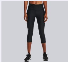
TÉRD ALATT (CAPRI)

Egyes modelleket extra meghosszabbított vagy lerövidített kivitelben is kínáljuk. A standard hosszúságot jelölő betű mellé hosszított kivitelek esetében T (pl. MT), rövidített kivitelek esetében pedig S betű (pl. MS) kerül.