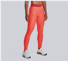
KÖZEPESEN MAGAS (MID RISE)