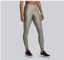
MAGASABB (HIGH RISE)