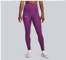
TELJES HOSSZ (FULL LENGHT)